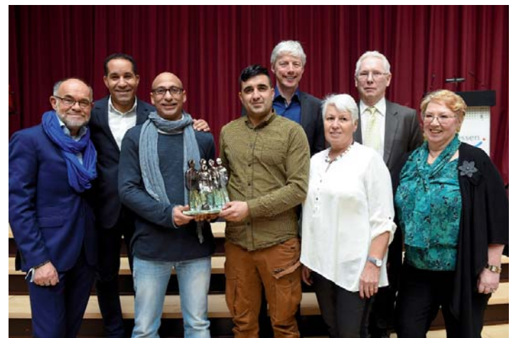
PREISVERLEIHUNG: Teilnehmer und Initiatoren des Fußballprojektes