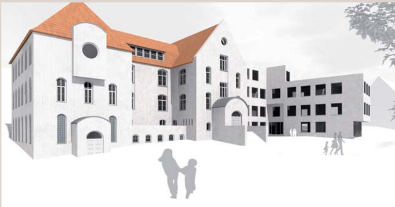
3-D-Skizze Hermann-Schafft-Schule, Homberg

samtkosten. Dort entstehen im Wesentlichen Klassenräume, ein Lehrerzimmer, ein Lernzentrum und ein Schülertreff mit Cafeteria. Die Bauarbeiten haben gerade begonnen.